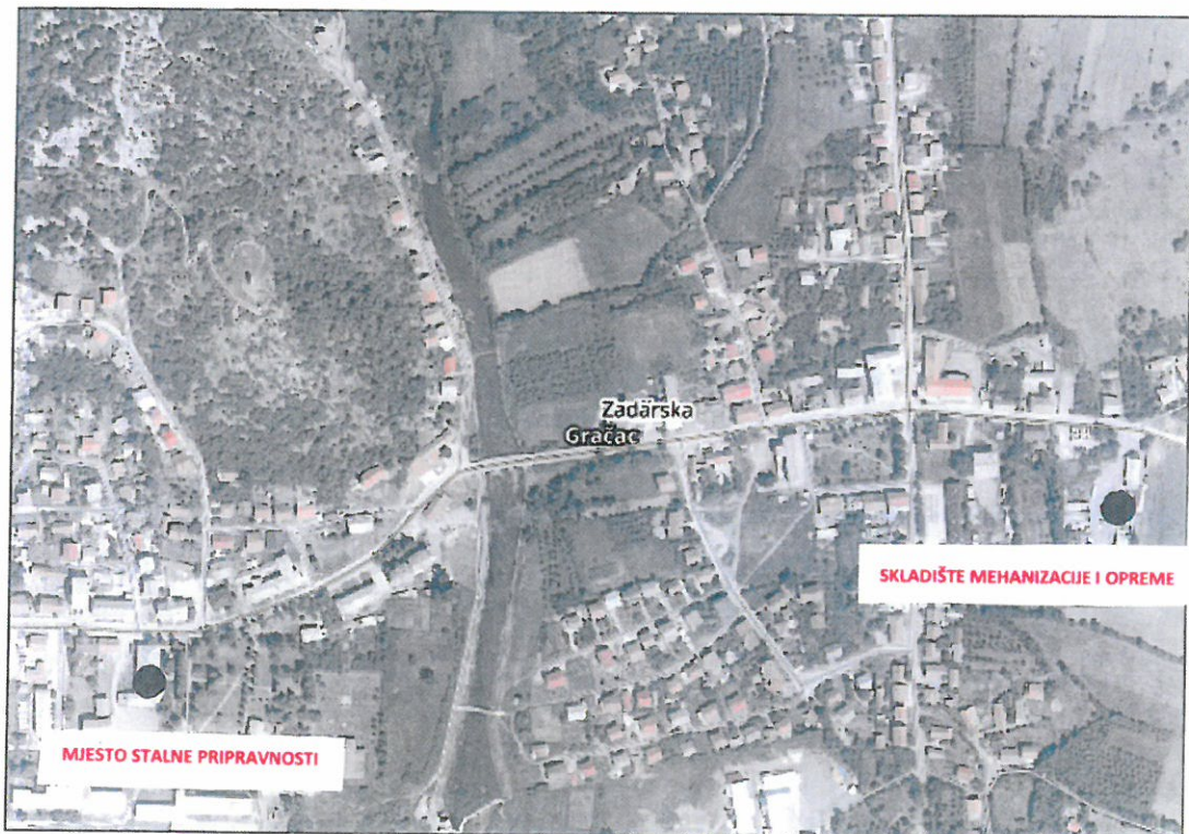
Slika 1. Lokacija mjesta pripravnosti i skladišta materijala i opreme na području Općine Gračac označena na karti DOF Geoportal

Mjesto pripravnosti se sukladno organizacijskim potrebama izvođenja radova zimske službe može ustrojiti i u naselju Srb, o čemu odgovorna osoba Izvoditelja radova donosi posebnu Odluku i o tome izvještava Stožer zimske službe Općine Gračac, odnosno odgovornu osobu Općine Gračac Općinsku načelnicu.