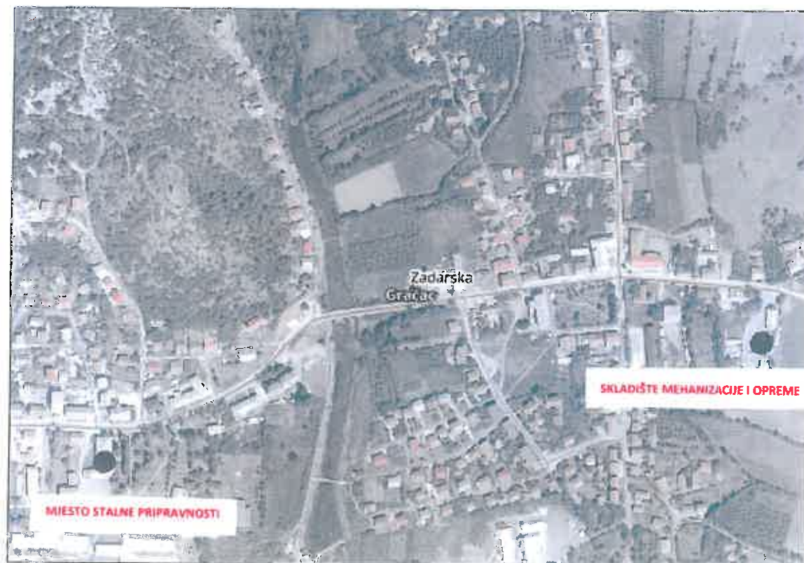
Slika 1. Lokacija mjesta pripravnosti i skladišta materijala i opreme na području Općine Gračac označena na karti DOF Geoportal

Mjesto pripravnosti se sukladno organizacijskim potrebama izvođenja radova zimske službe može ustrojiti i u naselju Srb, o čemu odgovorna osoba Izvoditelja radova donosi posebnu Odluku i o tome izvještava Stožer zimske službe Općine Gračac, odnosno odgovornu osobu Općine Gračac Zamjenika općinske načelnice koji obnaša dužnost općinskog načelnika Općine Gračac.