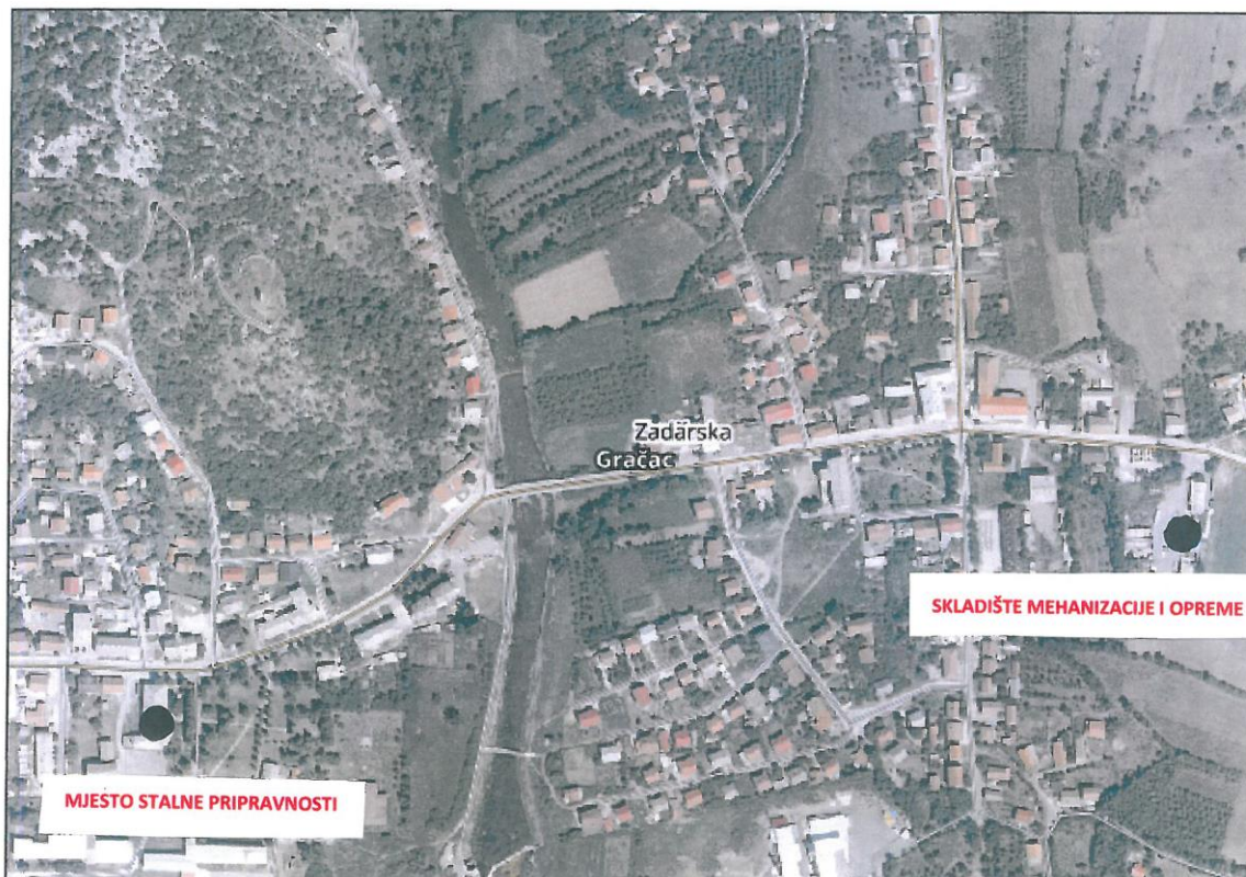
Slika 1. Lokacija mjesta pripravnosti i skladišta materijala i opreme na području Općine Gračac označena na karti DOF Geoportal

Mjesto pripravnosti se sukladno organizacijskim potrebama izvođenja radova zimske službe može ustrojiti i u naselju Srb, o čemu odgovorna osoba Izvoditelja radova donosi posebnu Odluku i o tome izvještava Stožer zimske službe Općine Gračac, odnosno odgovornu osobu Općine Gračac- Općinskog načelnika Općine Gračac.